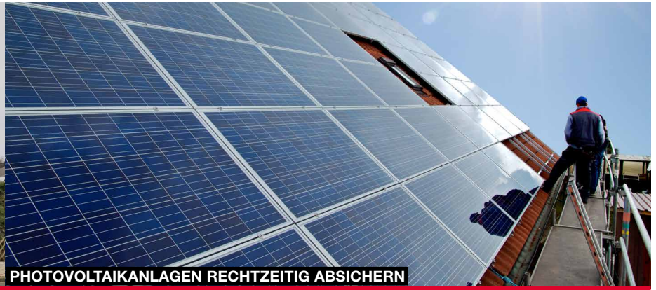
PHOTOVOLTAIKANLAGEN RECHTZEITIG ABSICHERN