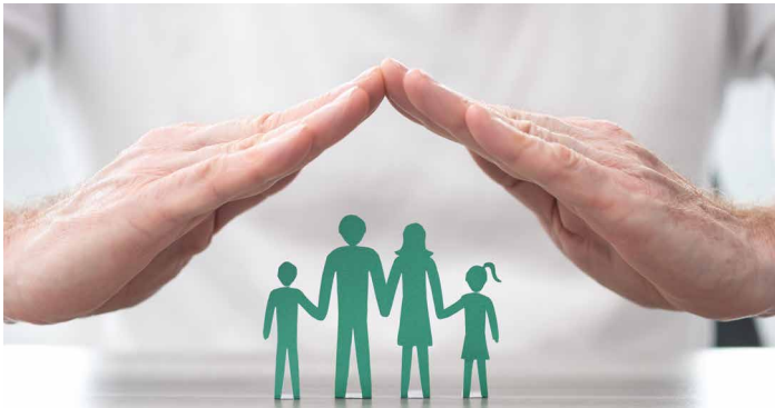
VERSICHERUNGEN FÜR EIN EIGENSTÄNDIGES LEBEN