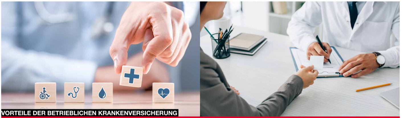
VORTEILE DER BETRIEBLICHEN KRANKENVERSICHERUNG